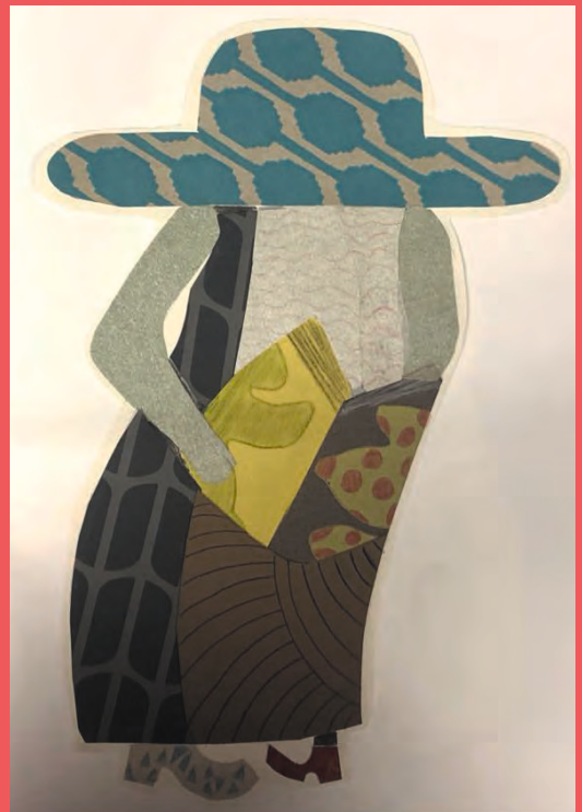
Werk van Lisa Verstraeten