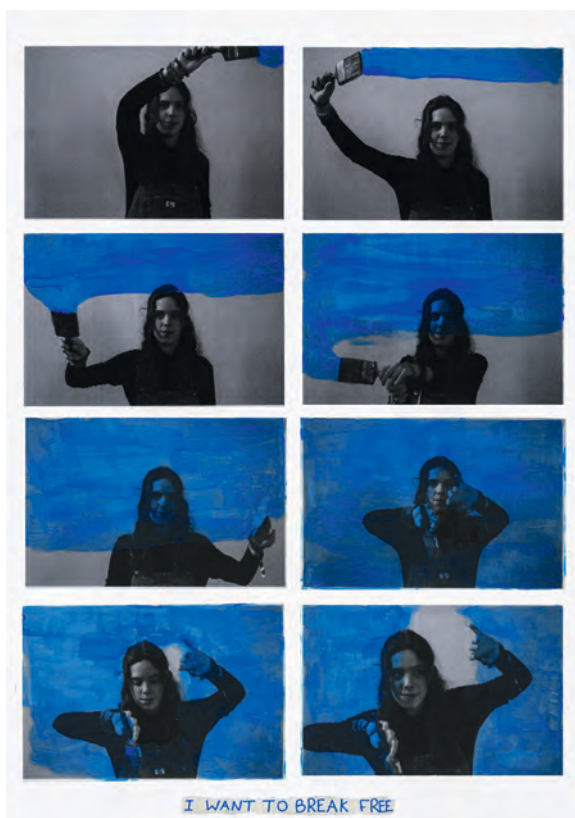
Werk van Minne Nieuwborg

Naast het specifieke gedeelte voor deze KSO-opleiding zijn de basisdoelstellingen in algemeen vormende vakken van groot belang. Zij ondersteunen de kunstvakken, maar garanderen ook een brede